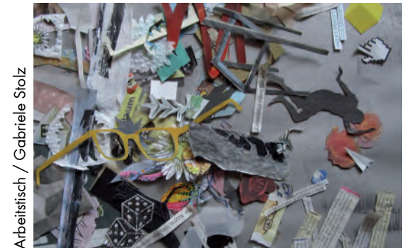
Arbeitsfisch / Gabriele Stolz