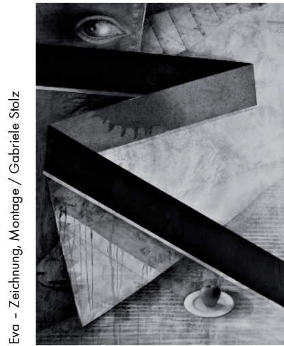
Eva - Zeichnung, Montage / Gabriele Stolz

Do 23.01. SPIELRÄUME: zeichnungen - montagen - gedichte 19:00 GABRIELE STOLZ